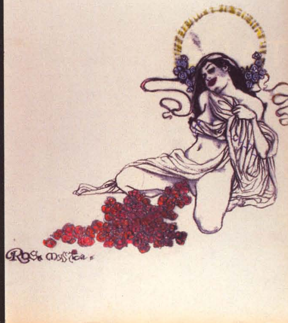
Rosa Mystica II, 2005.

L'artiste mêle sans différenciation son panthéon d'icônes de la culture rock (Siouxsie, Nico, Diamanda Galas), des références à la culture populaire – en reprenant notamment l'image de la montagne étoilée des films américains Paramount et il devient, sous ses crayons, l'expression du désir désormais joliment nommé par le jeu de mots « Paramour » ou « Paramor » – ou encore des clins d'œil à l'histoire de l'art qui resurgissent dans chacune de ses propositions. Le résultat donne à voir un syncrétisme artistique sans hiérarchisation des images. « L'artiste est bien l'héritier d'une tradition de la représentation du corps inscrite dans les arcanes de la haute culture, souligne Jean-Marc Réol, et peut-être même encore plus précisément l'héritier lointain d'un maniérisme où, dans la postérité de Michel-Ange, s'élabore la grande célébration du corps musculaire, il est aussi délibérément celui qui récupère une imagerie populaire puisée aux sources de la subculture punk. Et l'ombre portée de